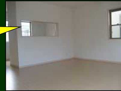
日当たり良いリビング