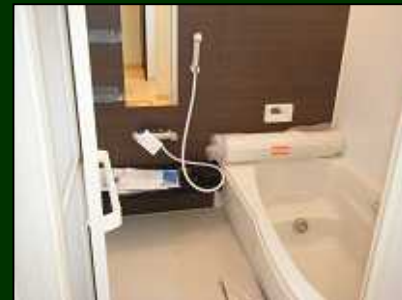
1坪バス乾燥機付き