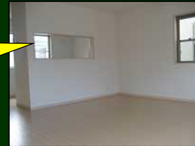
日当たり良いリビング