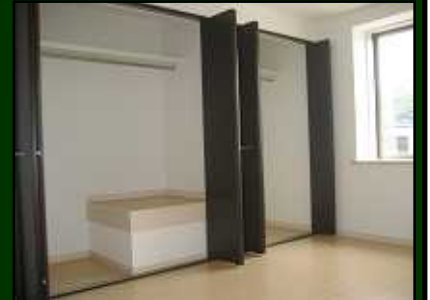
便利なクローゼット