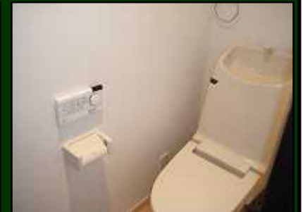
ウォッシュレット付き