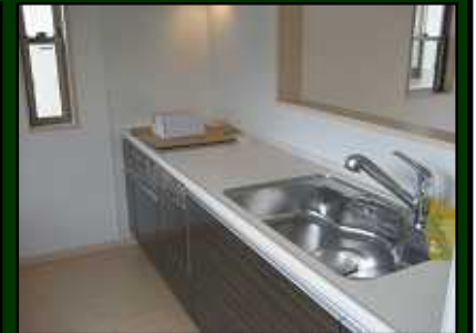
明るいカウンターキッチン